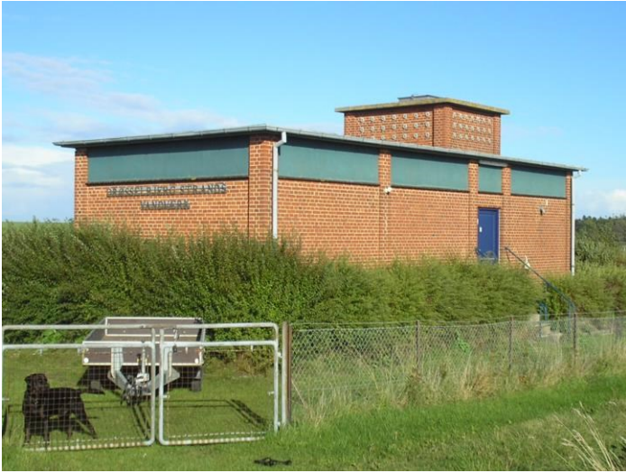
Vandværket på Søbo