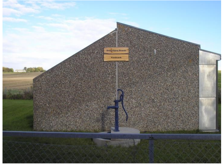
Trykforøgerstation på Valhallavej